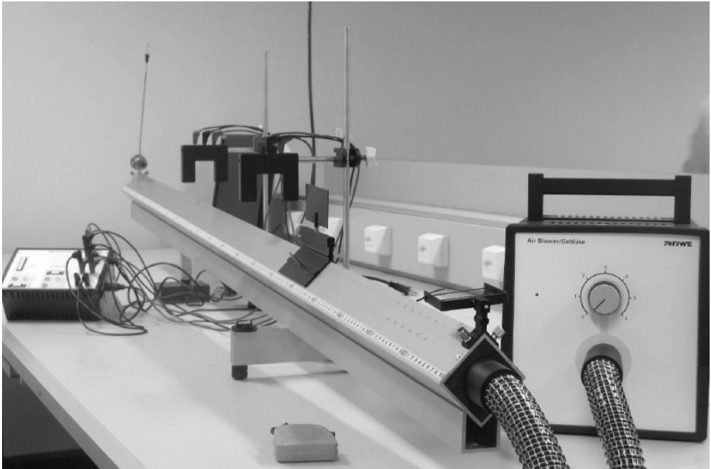
Figura 3: Trilho de ar inclinado.

formado pelos termos independentes do sistema.